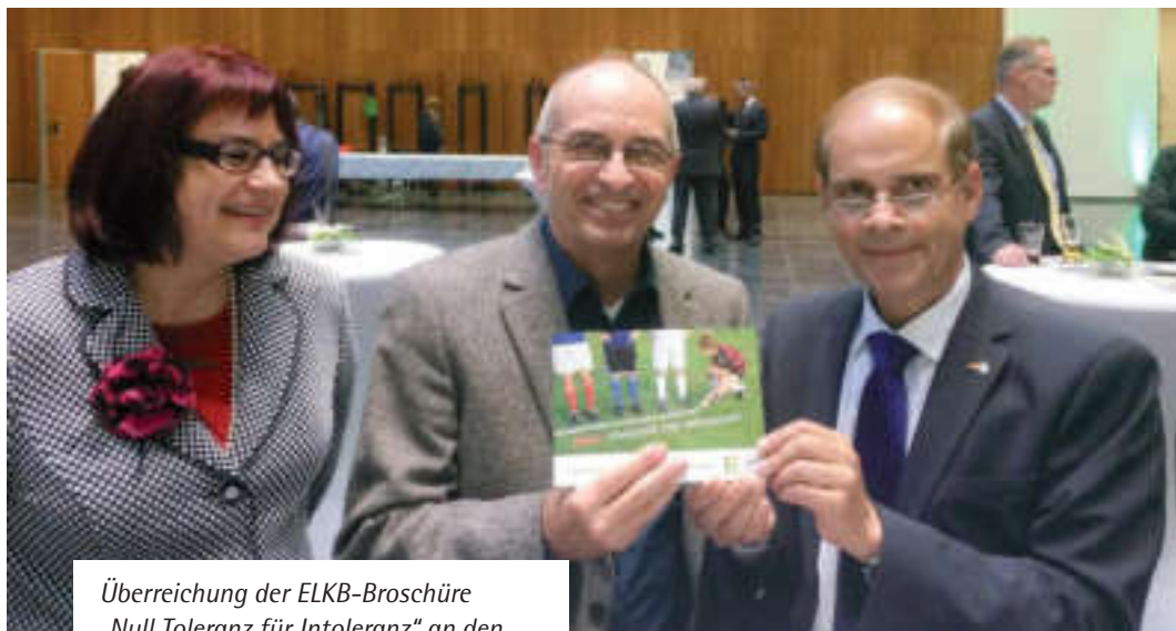
Überreichung der ELKB-Broschüre „Null Toleranz für Intoleranz“ an den Israelischen Botschafter Yakov Hadas-Handelsman (rechts) im Oktober 2014

unter zu den Auswirkungen auf diejenigen, die zum Ziel rechtsextremer Aggression werden. (c) Klärend sein kann auch die kritische Auseinandersetzung mit den Programmen und Zielen rechtsextremer Gruppierungen, da hier der Kontrast zum christlichen Menschen- und Gesellschaftsbild offenkundig wird. (d) Um die menschenverachtende Ideologie des Rechtsextremismus rechtzeitig erkennen und abweisen zu können, kann zudem eine Auseinandersetzung mit Argumentations- und Werbestrategien der rechtsextremen Szene ertragreich sein. 33 Damit Rechtsextremismusprävention ganzheitlich wirken kann, ist es über diese Form der Kompetenzvermittlung hinaus notwendig, Jugendlichen Lernorte für demokratisches und tolerantes Verhalten zur Verfügung zu stellen. 34