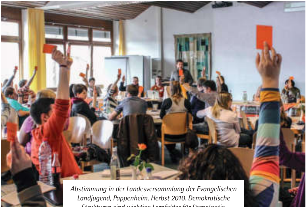
Abstimmung in der Landesversammlung der Evangelischen Landjugend, Pappenheim, Herbst 2010. Demokratische Strukturen sind wichtige Lernfelder für Demokratie.