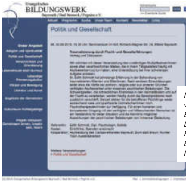
Fortbildungsveranstaltung des Evangelischen Bildungswerks Bayreuth / Bad Berneck / Pegnitz e.V.