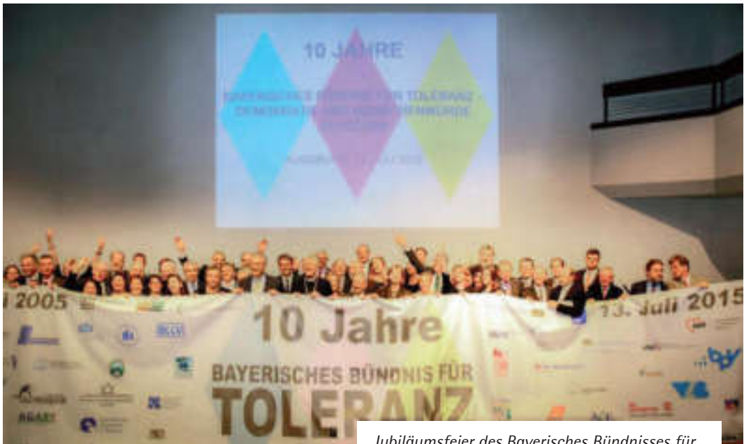
Jubiläumsfeier des Bayerisches Bündnisses für Toleranz 2015 in Augsburg

rechtsextreme Einstellungen, Haltungen und Handlungen zu entwickeln und damit für Demokratie, Menschenrechte und Toleranz zu werben. Zusammen mit der katholischen Kirche entstand die Idee, ein Bayerisches Bündnis gegen Menschenverachtung zu initiieren, das schließlich den Namen „Bayerisches Bündnis für Toleranz – Demokratie und Menschenwürde schützen“ erhielt.