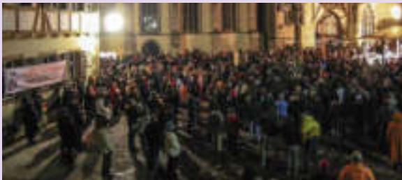
Kundgebung gegen Rechtsextremismus in Weißenburg nach dem Anschlag auf das Weißenburger Jugendzentrum im Jahr 2011