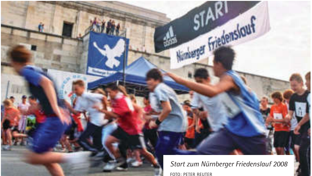
Start zum Nürnberger Friedenslauf 2008