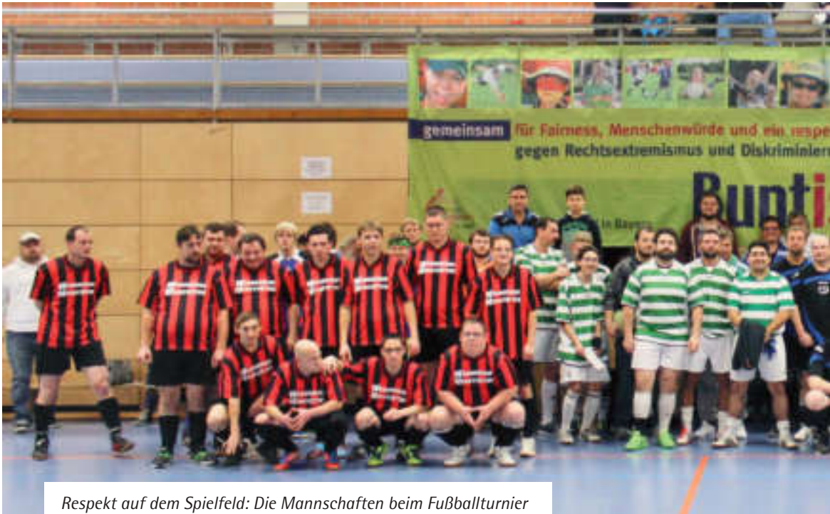
Respekt auf dem Spielfeld: Die Mannschaften beim Fußballturnier „Bunt ist cool“ 2014 in Nürnberg.