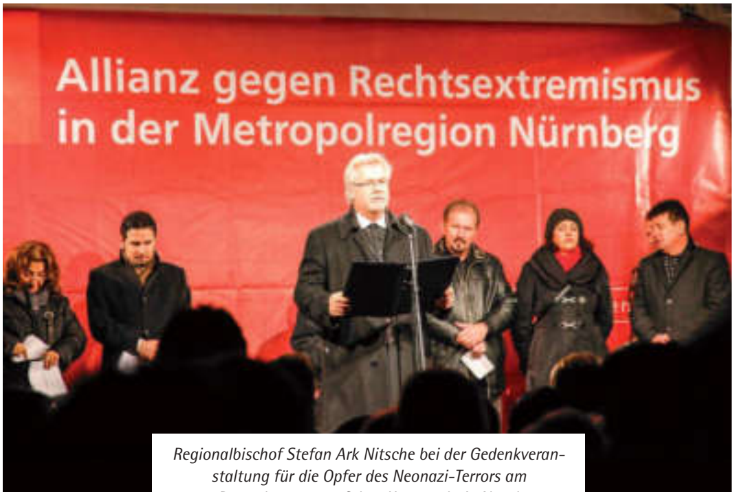
Regionalbischof Stefan Ark Nitsche bei der Gedenkveranstaltung für die Opfer des Neonazi-Terrors am 10. Dezember 2011 auf dem Kornmarkt in Nürnberg