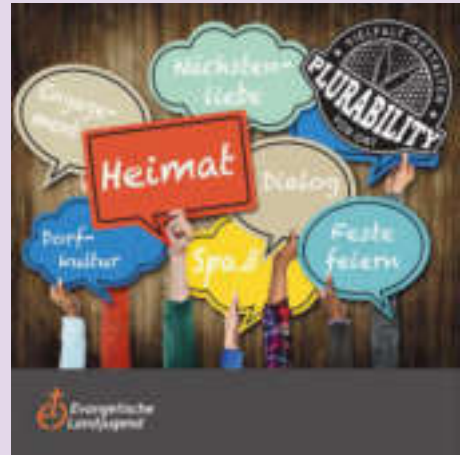
Flyer „Plurability“ der Evangelischen Landjugend

Logo sind ein provokatives Signal: Auf Augenhöhe und im Gespräch mit jungen Menschen bietet Plurability ein Lernfeld, um sich und seine Jugendarbeit der Vielfalt und Bedürfnissen vor Ort zu öffnen.