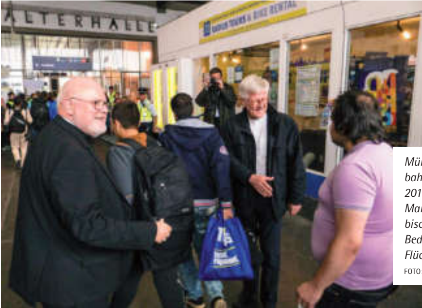
Münchener Hauptbahnhof im September 2015: Kardinal Reinhard Marx und Landesbischof Heinrich Bedford-Strohm heißen Flüchtlinge willkommen.