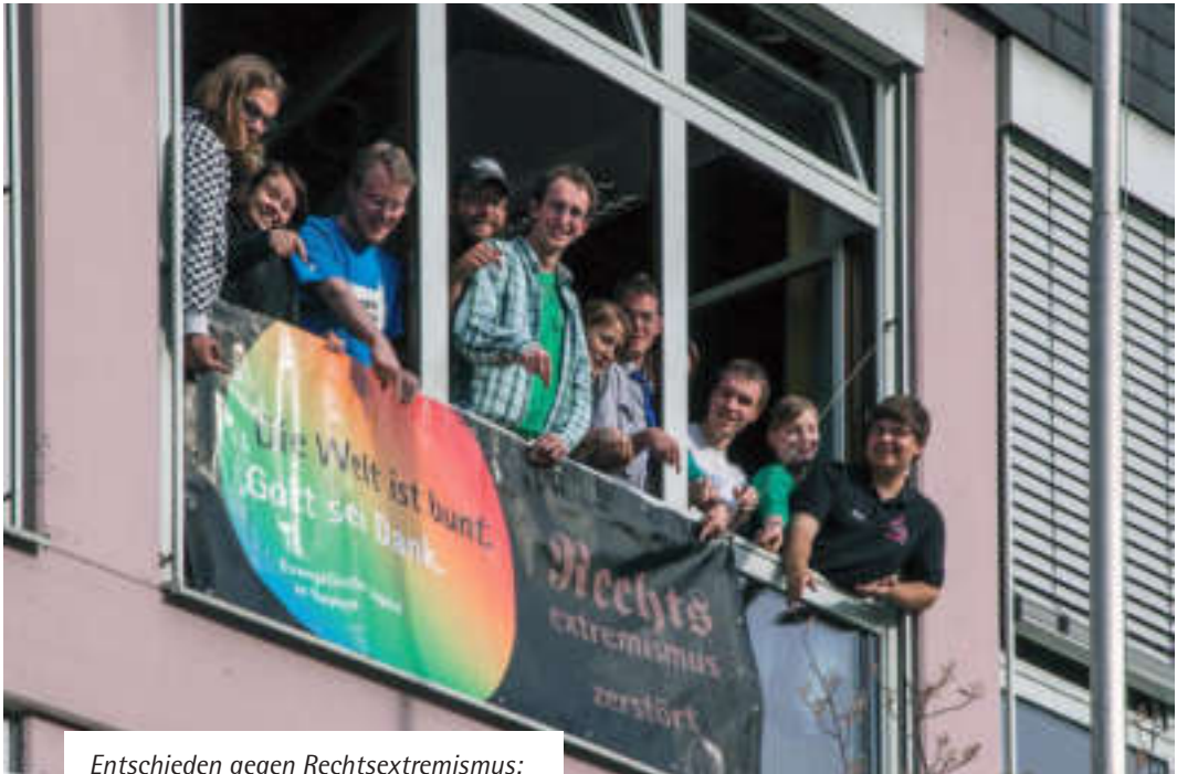
Entschieden gegen Rechtsextremismus: die Evangelische Jugend in Bayern