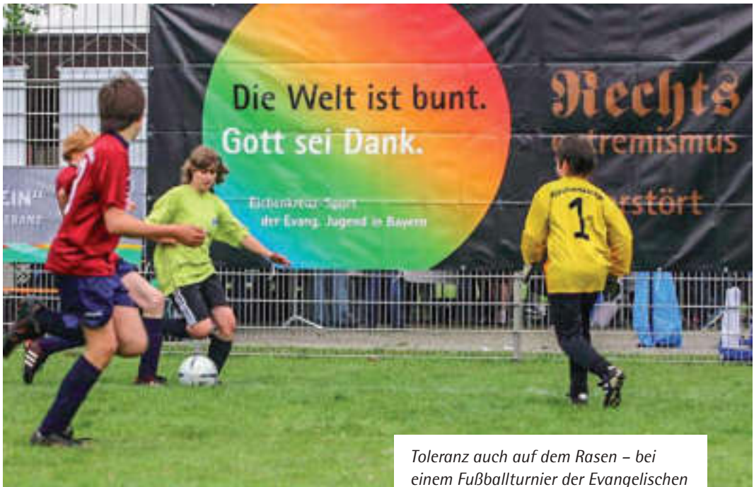
Toleranz auch auf dem Rasen – bei einem Fußballturnier der Evangelischen Jugend.

me, menschenverachtende Einstellungen und Verhaltensweisen zu entfalten. 50